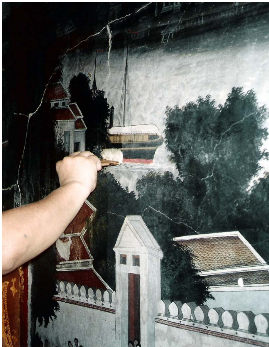
รอยร้าวและรอยแตกของปูนฉาบผนัง