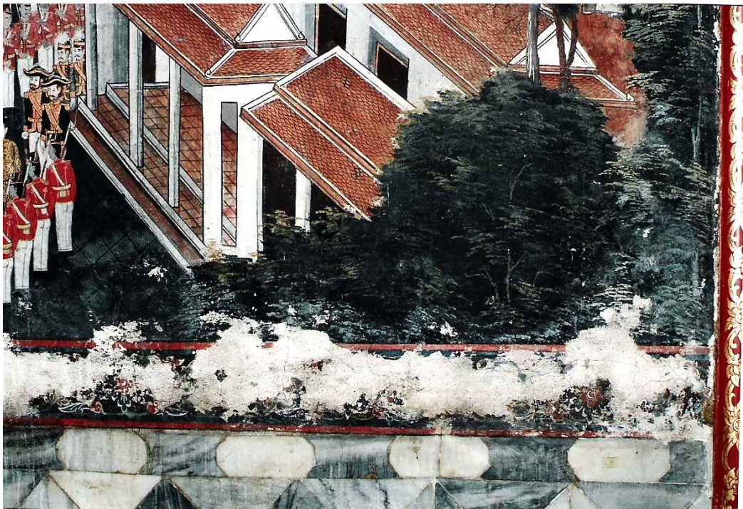
สภาพชั้นดีและชั้นรองพื้นจิตรกรรมเสื่อมสภาพ